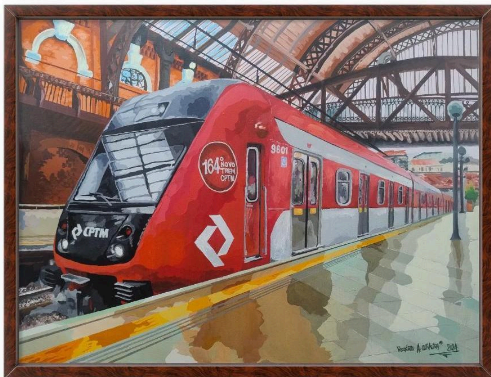
Dimensões: 80x 60 cm. Acrílico sobre painel.

A obra "Próxima Estação, Luz", é uma pintura em acrílico sobre tela, medindo 70 x 50 cm. A pintura retrata um trem da CPTM (Companhia Paulista de Trens Metropolitanos) na histórica estação da Luz, em São Paulo. Esta obra faz parte de uma pesquisa que explora histórias e memórias afetivas, refletindo sobre os momentos e relacionamentos que se iniciam e terminam, bem como sobre o cotidiano e as experiências marcantes que se entrelaçam ao longo do tempo. A pintura captura não apenas a arquitetura da estação, mas também a importância emocional e cultural que este lugar representa para muitas pessoas.