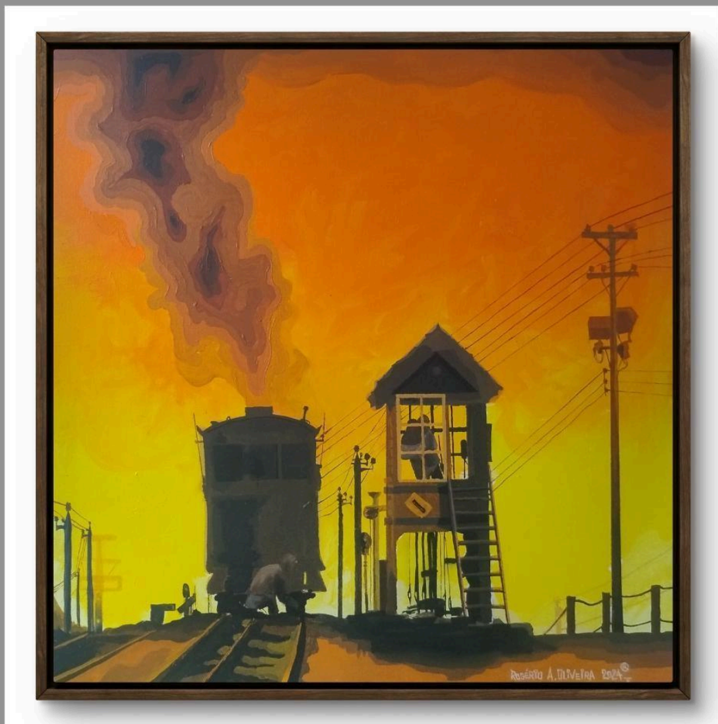
Dimensões: 50x 50 cm. Acrílica sobre painel.

A cena capturada na pintura exhibe um amanhecer, com tons quentes de laranja e amarelo dominando o céu. A locomotiva em destaque solta uma espessa coluna de fumaça, enquanto à direita podemos observar uma torre de sinalização ferroviária, no qual abriga um operador em seu interior. Os trilhos e a figura humana presentes na composição enfatizam o ambiente ferroviário histórico. Os contrastes entre sombras e luz, além do uso de silhuetas, criam uma atmosfera dramática e nostálgica, refletindo a importância histórica e emocional do sistema funicular de Paranapiacaba na memória coletiva.